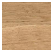
3058 Безколірна матова