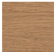
3028 Безколірна шовковисто- матова