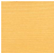
420 Бесцветное шелковисто- матовое